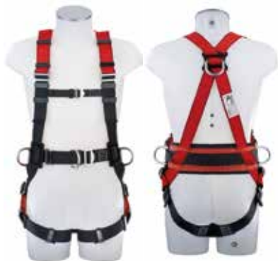
Typ MAS 90 S Economy Vorder- und Rückseite