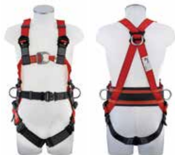
Typ MAS 70 Quick Vorder- und Rückseite