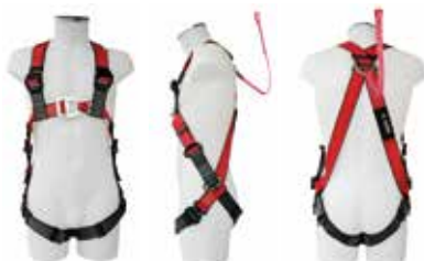
Typ MAS 40 Quick B3 mit Gurtbandverlängerung