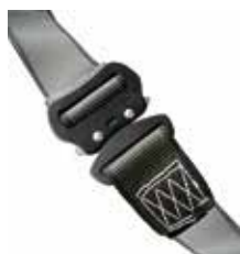
Typ MAS 90 S Quick Economy