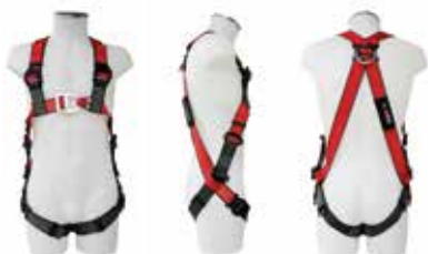
Typ MAS 40 Quick